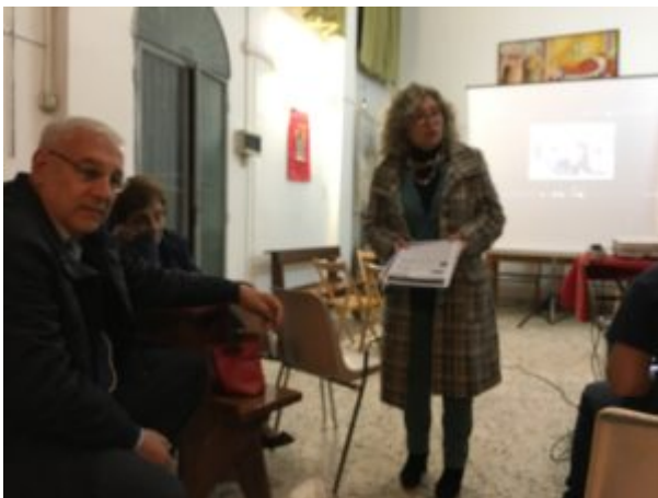
Per amore dell'acqua

L'accesso a questa «sor'Acqua» ( Cantico delle creature , v. 7) è un diritto inalienabile, individuale e collettivo. E' di tutti e per tutti, come di tutti e per tutti è la «sora nostra madre Terra» ( ivi , v. 9). Anch'essa è in pericolo. Siamo seduti su una bomba a orologeria e rischiamo l'estinzione. Il dibattito è finito da tempo e la verità va detta: l'«effetto serra» sta avendo effetti devastanti e, se non agiremo subito, saremo testimoni di una catastrofe di proporzioni terrificanti, impensabili, inimmaginabili.