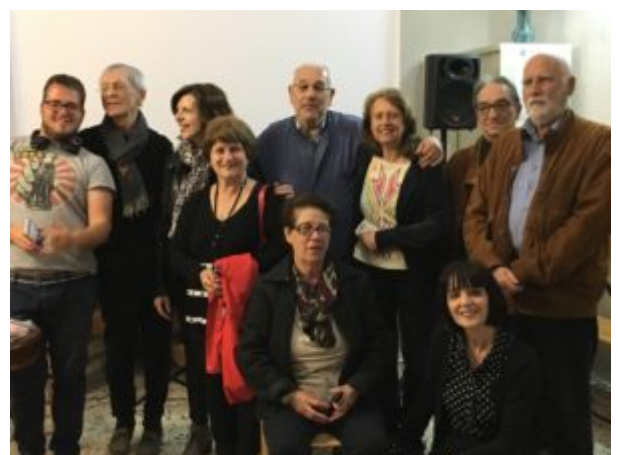
Una scomoda verità