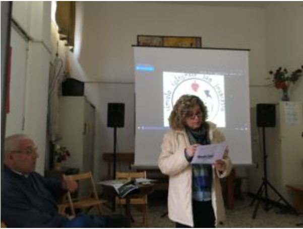
Una scomoda verità