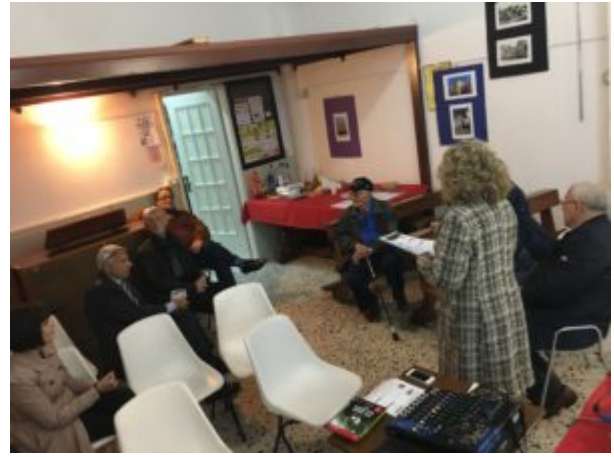
Per amore dell'acqua

Secondo la maggior parte degli scienziati del mondo ci resta poco per evitare questa catastrofe che potrebbe innescare una spirale distruttiva nell'intero sistema climatico del Pianeta: scarseggerà l'acqua potabile, aumenteranno i periodi di siccità, si registreranno ondate di caldo letali, epidemie e grandi esodi. Sempre più frequenti saranno uragani violenti e di conseguenza si verificheranno gigantesche inondazioni di città... con morti, danni e perdite economiche. Questa è la scomoda verità che ci ha presentato il documentario di Davis Guggenheim, attraverso le parole di Al Gore. Scomoda ai governi, alle multinazionali, a coloro che non si rendono conto che lo sviluppo, così com'è stato concepito fino ad ora, non può essere infinito. Gore, che ha partecipato ai negoziati per il protocollo di Kyoto (1997), sembra essere uno dei pochi americani ad aver capito con chiarezza la drammaticità della situazione.