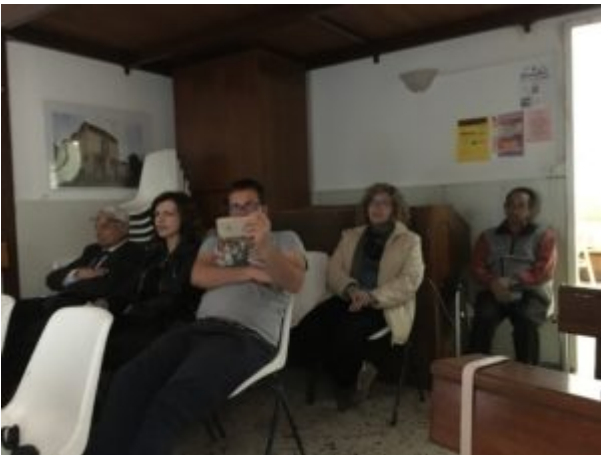
Una scomoda verità