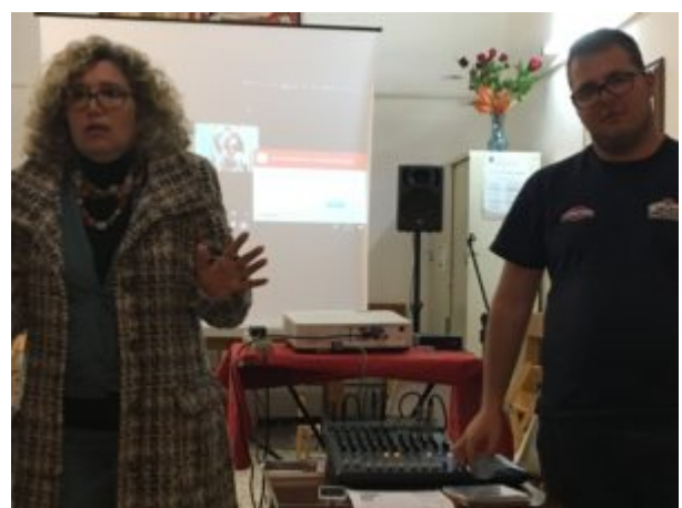
Per amore dell'acqua