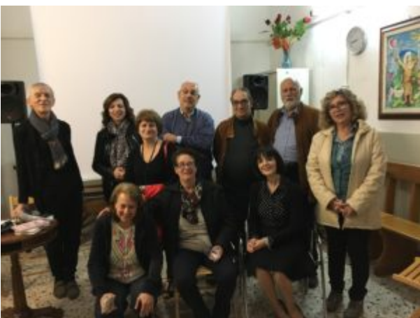
Una scomoda verità