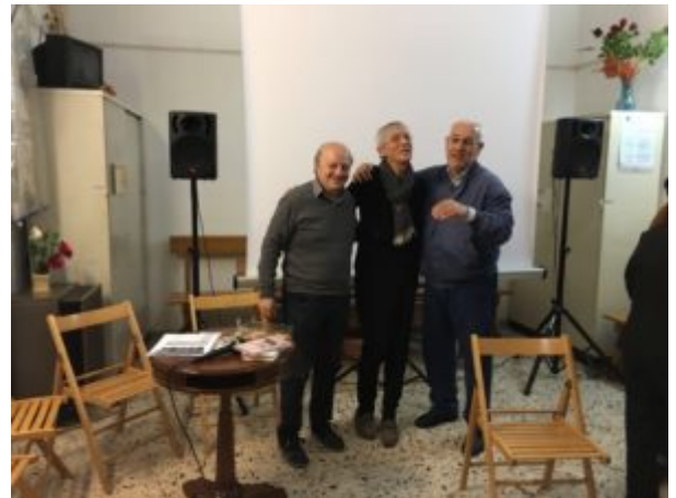
Una scomoda verità