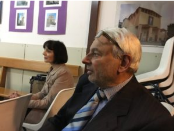
Per amore dell'acqua