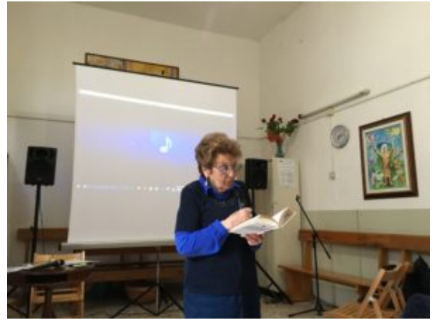
Una scomoda verità