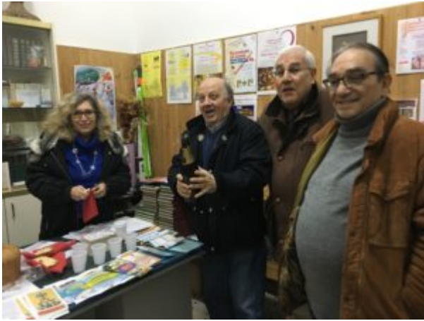
Un brindisi al 2018 e alla 6ª edizione delle Serate