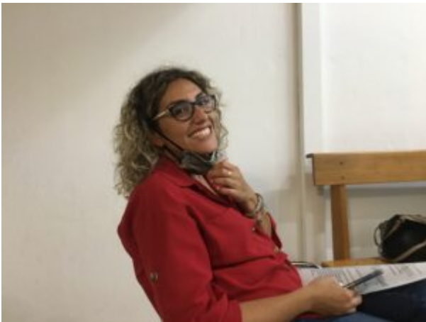
In quel sorriso c'è tutto