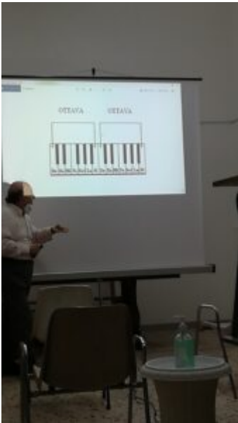
Nel rispetto delle normative anti-Covid...