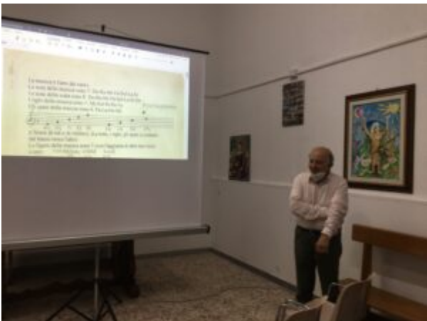
La musica è l'arte dei suoni