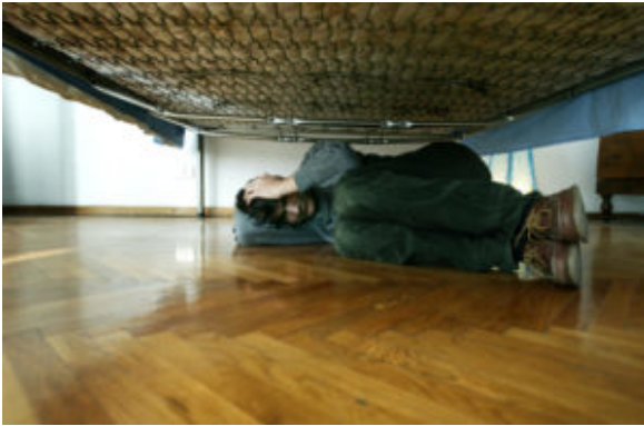
Depressed boy under the bed