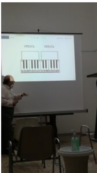
Nel rispetto delle normative anti-Covid..