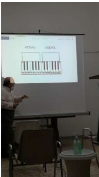
Nel rispetto delle normative anti-Covid..