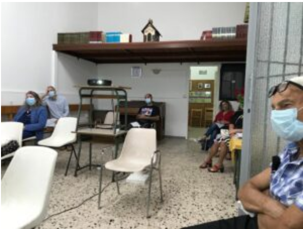
Insieme renderemo più 'sinfonico' il mondo