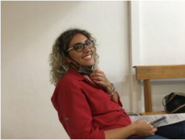
In quel sorriso c'è tutto