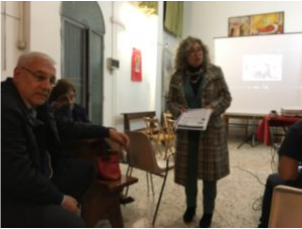
Per amore dell'acqua