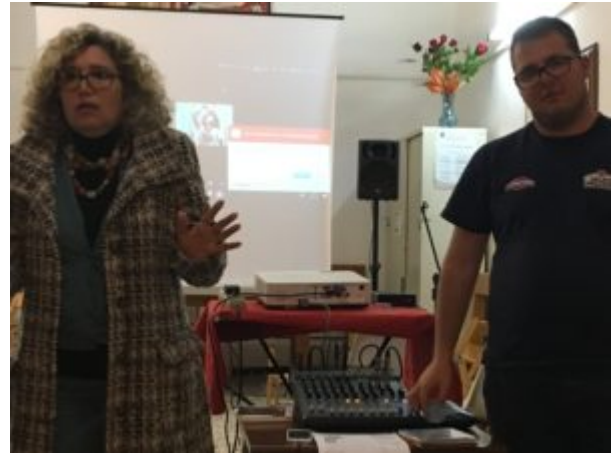
Per amore dell'acqua