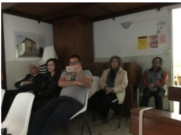
Una scomoda verità