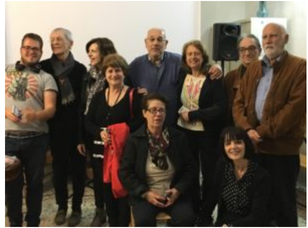
Una scomoda verità

Come però è possibile affrontare il surriscaldamento globale del Pianeta? Basterà lo sviluppo di energie alternative: eoliche, solari, termonucleari, e l'abbandono dei combustibili fossili tradizionali? Sarà sufficiente modificare le case con impianti solari e finestre termiche, cambiare le lampadine di casa con quelle a basso consumo, utilizzare l'aria condizionata solo quando necessario, mettere sulle auto impianti a gas o acquistare auto ibride, dedicarsi alla raccolta dei rifiuti abbandonati, piantare un albero? Comunque, per salvare il mondo dall'autodistruzione, bisogna agire, in fretta e alla svelta. E' il momento di smettere di restare immobili. Bravissimo il regista Davis Guggenheim e ancor più bravo Al Gore, che è riuscito ad entusiasmarci con questo film, impegnandoci in una vera e propria missione: quella di partecipare alla grande sensibilizzazione dell'umanità sull'inquinamento e sul surriscaldamento della «sora nostra madre Terra». Grazie, Al! E grazie, Staff del Cine- e WikiCircolo!