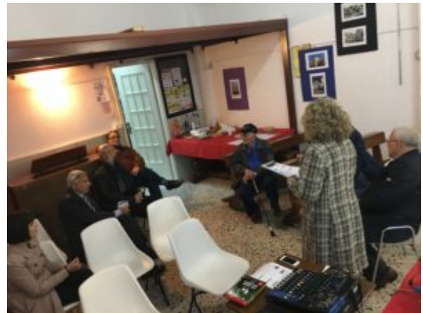
Per amore dell'acqua

Secondo la maggior parte degli scienziati del mondo ci resta poco per evitare questa catastrofe che potrebbe innescare una spirale distruttiva nell'intero sistema climatico del Pianeta: scarseggerà l'acqua potabile, aumenteranno i periodi di siccità, si registreranno ondate di caldo letali, epidemie e grandi esodi. Sempre più frequenti saranno uragani violenti e di conseguenza si verificheranno gigantesche inondazioni di città... con morti, danni e perdite economiche. Questa è la scomoda verità che ci ha presentato il documentario di Davis Guggenheim, attraverso le parole di Al Gore. Scomoda ai governi, alle multinazionali, a coloro che non si rendono conto che lo sviluppo, così com'è stato concepito fino ad ora, non può essere infinito. Gore, che ha partecipato ai negoziati