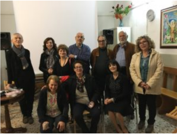
Una scomoda verità