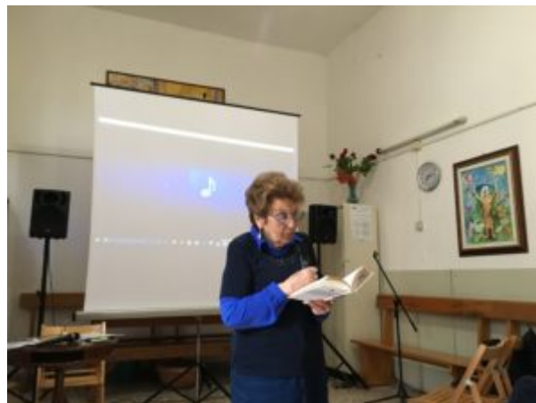
Una scomoda verità