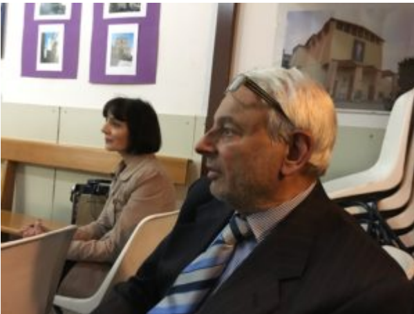
Per amore dell'acqua