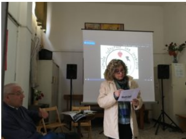
Una scomoda verità

per il protocollo di Kyoto (1997), sembra essere uno dei pochi americani ad aver capito con chiarezza la drammaticità della situazione.