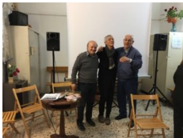
Una scomoda verità